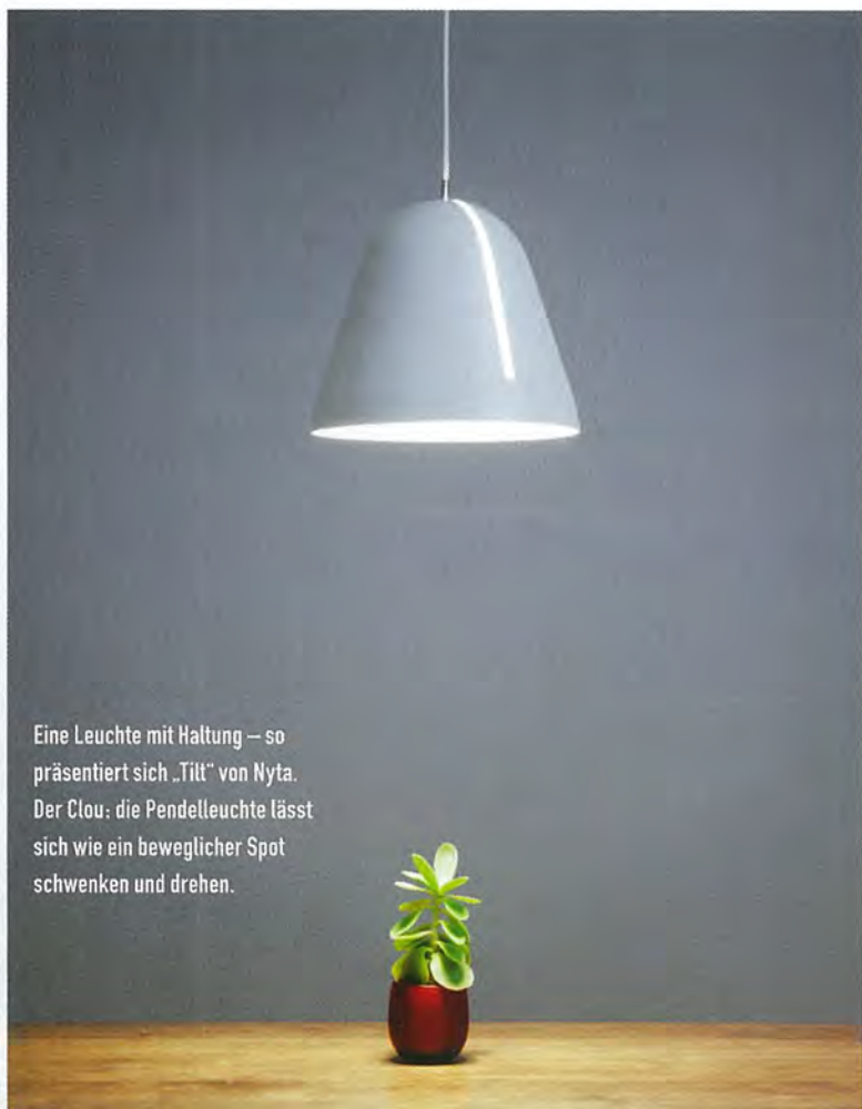
Eine Leuchte mit Haltung – so präsentiert sich „Tilt“ von Nyta. Der Clou: die Pendelleuchte lässt sich wie ein beweglicher Spot schwenken und drehen.

Machen Sie sich zuerst Gedanken darüber, für welche Situation die neue Leuchte verwendet werden soll und welches Licht Sie sich wünschen. Entweder Sie benötigen sanftes Stimmungslicht, um Ihr Wohlbefinden zu steigern. Dann kommen große, oft sogar nach allen Seiten leuchtende Objekte infrage, die eine bestimmte Aura schaffen und die im Mittelpunkt des Interesses stehen wollen. Oder Sie benötigen fokussiertes Zonenlicht, wie es sich etwa zum Essen über dem Tisch empfiehlt. Hier ist die Auswahl noch größer: sie reicht von einfachen Lampenschirmen, die Sie über die Fassung Ihrer Lampe stülpen, bis hin zu technisch und gestalterisch ausgefeilten Lösungen in allen Größen und Preisklassen. Eine dritte Beleuchtungsvariante für Pendelleuchten ist das Raumlicht, mit dem Sie die Grundbeleuchtung in Ihrem Zimmer modellieren. Hier gibt es Leuchten, die ihr Licht vor allem nach oben abgeben und den Raum ▶