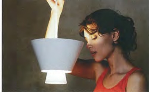
So mystisch wie der Name ist auch das Licht der „Hehku“-Hängeleuchte. Die Leuchte von LND Design gibt es in Weiß, Schwarz oder „Sand“.

Einer der klassischen Orte für Pendelleuchten ist der Esstisch.